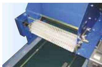
▲ 共土覆土用ブラシユニット(オプション)